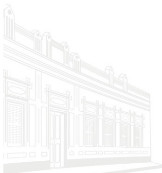
Casa de Melgaço - 1ª Sede 1955